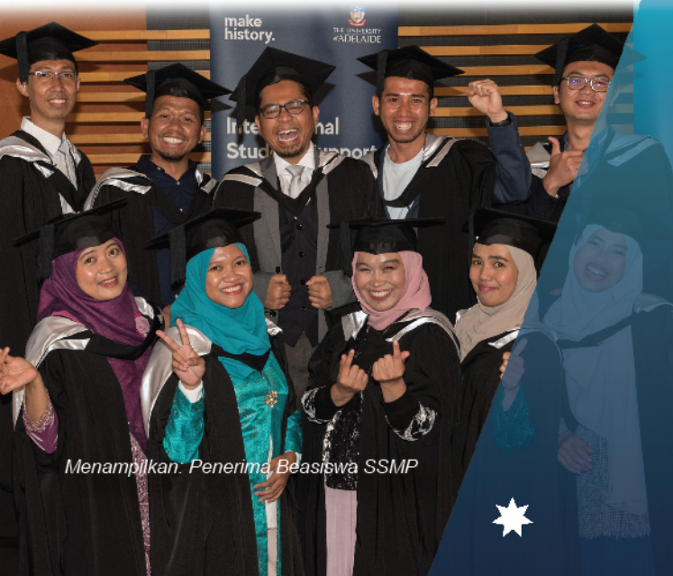
Menampilkan: Penerima Beasiswa SSMP

Program Magister Ilmu Ekonomi dan Masters of Economics and Resource Policy (CRICOS Code: 113828E)