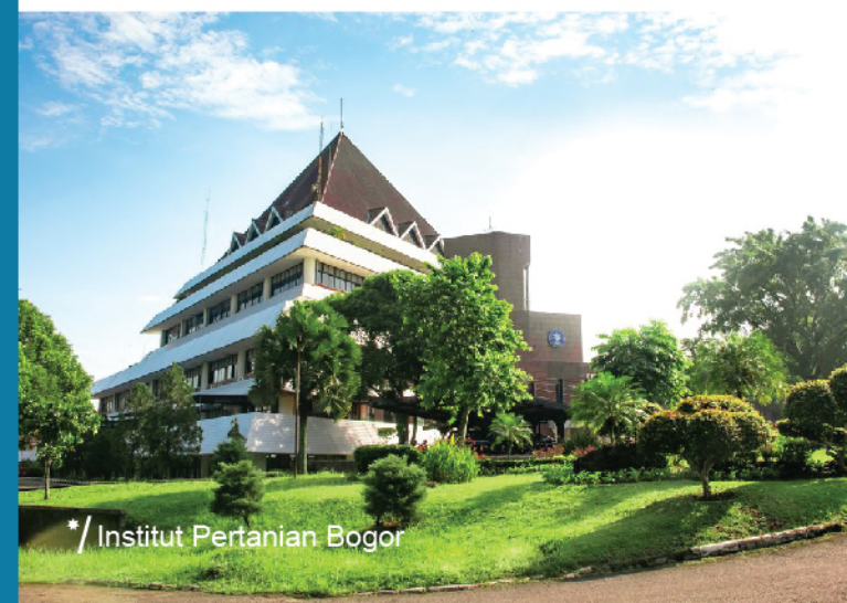
* / Institut Pertanian Bogor